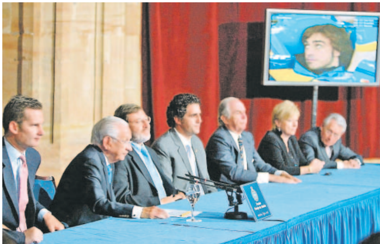
Gran Premio de Asturias. El piloto de Fórmula 1 Fernando Alonso fue ayer galardonado con el Príncipe de Asturias del Deporte, cuyo jurado (en la imagen) destacó su trayectoria deportiva como «consecuencia de la firme voluntad por el triunfo»