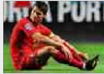
La recaída con Portugal.

> Portugal. El 'crack' del Real Madrid reapareció el 10 de octubre, en el Portugal-Hungría de clasificación para el Mundial de 2010. A los 15 minutos del encuentro se retiró al resentirse de la lesión.