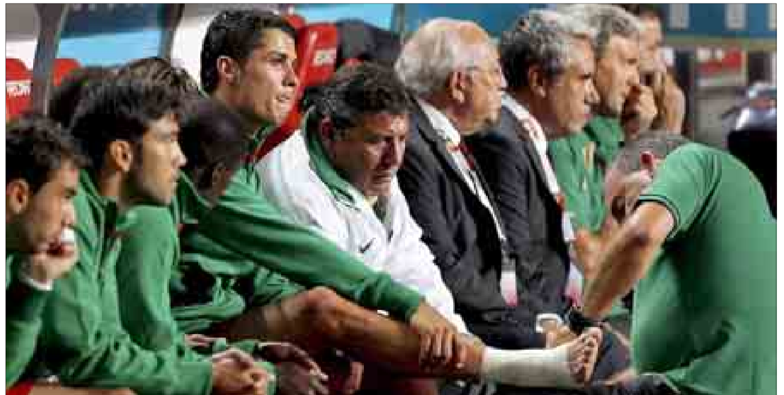
Ronaldo es atendido por el médico de Portugal tras resentirse del esguince de tobillo, el pasado 10 de octubre.

Las pruebas practicadas en Holanda han dejado clara la persistencia del edema óseo en el maleolo tibial interno. En esas condiciones, es imposible no sólo que el jugador pueda intervenir en un partido oficial, sino que pueda comenzar a trabajar al mismo ritmo que sus compañeros. No jugará la Copa, ni la repesca frente a Bosnia ni el duelo liguero del día 21 contra el Racing.