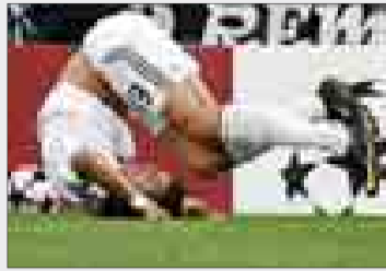
La lesión, ante el Olympique.

> La falta de Diawara. El inicio de la nefasta racha del delantero portugués se produjo en el partido de la 'Champions' (30 de septiembre) frente al Olympique de Marsella, cuando Diawara le pro-